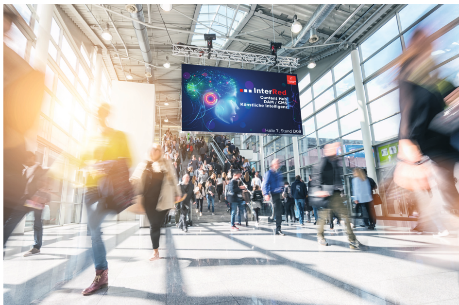
InterRed präsentiert auf der Hannover Messe 2023 die neueste Version des InterRed ContentHub.

vorab vereinbart werden: www.interred.de/events